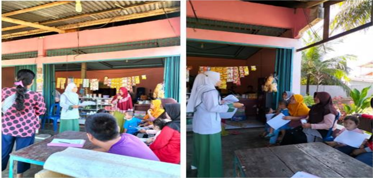
Gambar 2. Penyampaian Materi tentang TBC (Tuberkulosis)