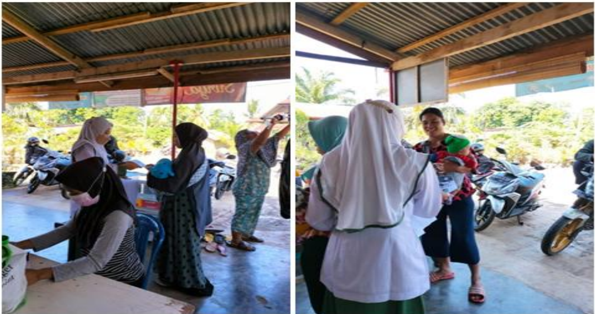
Gambar 1. Pembagian Leaflet Kepada Warga