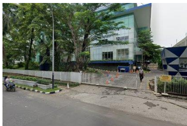
Gambar 2. Gedung Kantor PT ISS Indonesia

Objek penelitian dalam tulisan ini adalah data aset di gedung PT. ISS Indonesia, Tangerang Selatan, Banten.