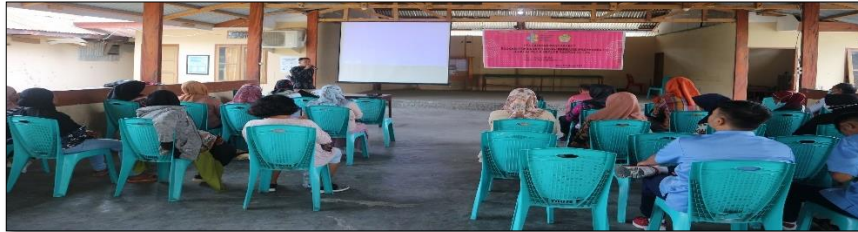
Keterangan : Arahan dari Dinas Lingkungan Hidup Kota Palu

Pelaksanaan edukasi pengabdian masyarakat di Kelurahan Talise dihadiri oleh undangan yaitu khusus perempuan.