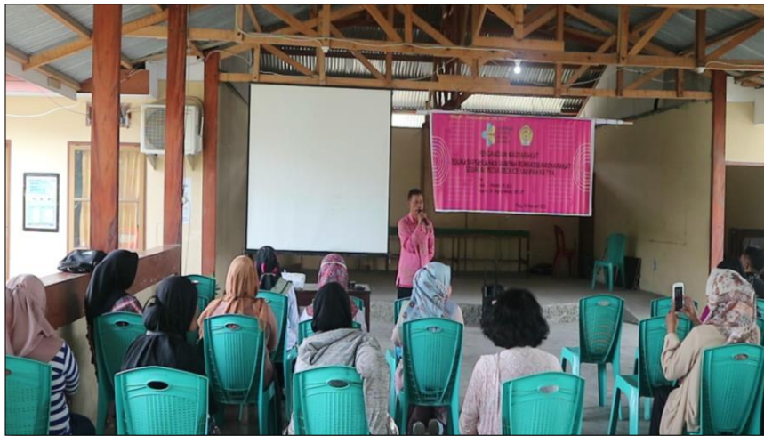
Keterangan : Arahan & Pembukaan dari Kelurahan Talise