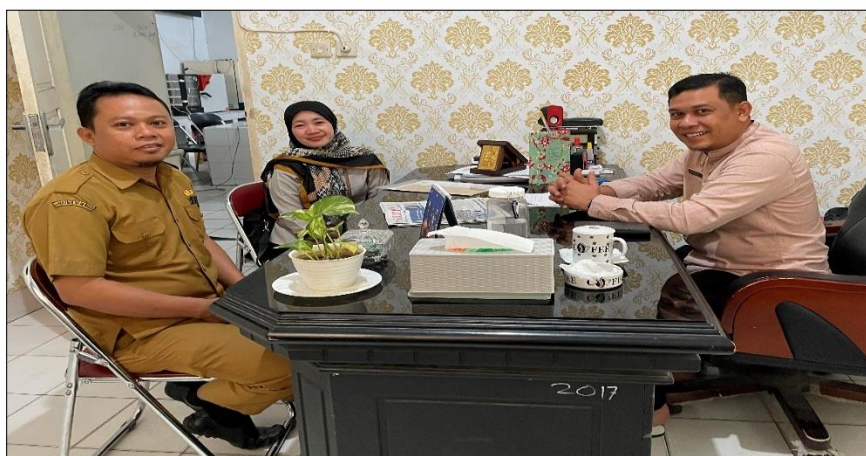
Gambar 1. Diskusi Bersama Kepala Dinas Lingkungan Hidup Kota Palu & Bidang Pengelola Sampah di TPA

Diskusi bersama Dinas Lingkungan Hidup Kota Palu sebagai pemilik wilayah dalam upaya pengelolaan sampah di Kota Palu agar kegiatan dapat terlaksana dengan maksimal dan manfaat.