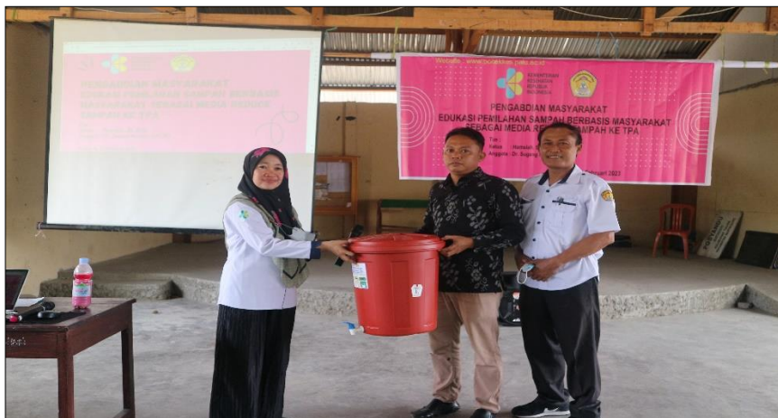
Keterangan : Penyerahan Tempat Percontohan Untuk Pengolahan Sampah Organik yang Berasal dari Dapur Kapasitas 40 Liter