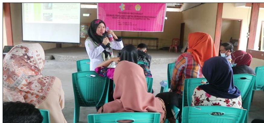
Keterangan : Diskusi Bersama Peserta