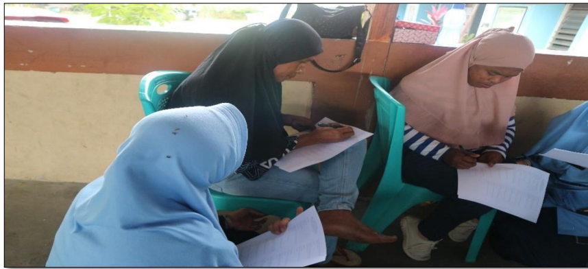
Keterangan : Pengisian Kuesioner Untuk Mengetahui Pentingnya Pengelolaan Sampah