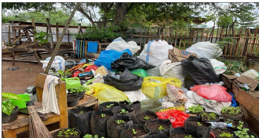
Keterangan : Survei Lokasi Pengelolaan Sampah Plastik dan Organik