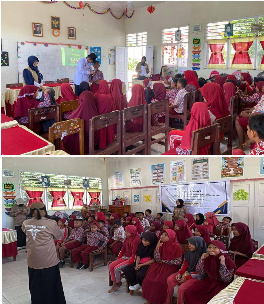
Gambar 1 Pemberian Edukasi berbasis story telling

Gambar menunjukkan kegiatan edukasi cuci tangan dengan metode story telling di dalam kelas. Tim pengabdian menyampaikan cerita menarik sambil memperagakan langkah cuci tangan, sehingga suasana belajar menjadi menyenangkan. Siswa terlihat antusias, aktif menjawab pertanyaan, dan mengikuti gerakan yang dicontohkan. Salah satu siswa berpendapat bahwa belajar dengan cerita membuat materi lebih mudah dipahami dan tidak membosankan, sehingga mereka lebih ingat pentingnya mencuci tangan dengan benar.