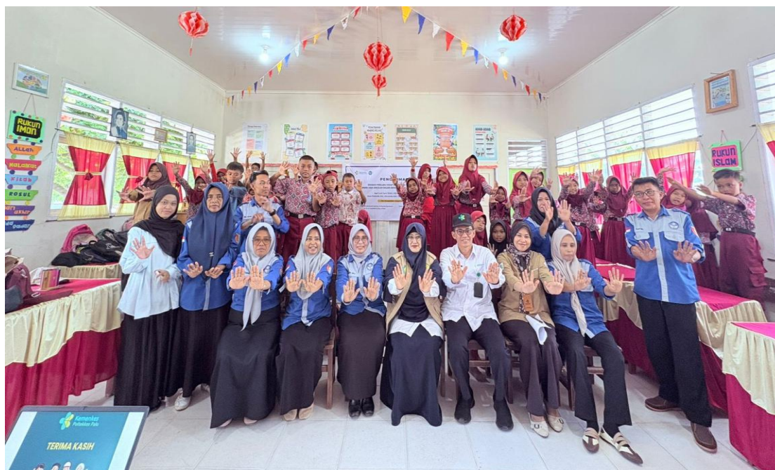
Gambar 2 Foto Bersama Peserta

Kepala sekolah dan para Guru juga memberikan tanggapan positif terhadap kegiatan tersebut. Menurut guru, metode story telling sangat efektif karena mampu menarik perhatian siswa dan membuat mereka lebih aktif dalam belajar. Guru juga menilai siswa menjadi lebih mudah memahami pentingnya cuci tangan serta lebih termotivasi untuk mempraktikkannya dalam kehidupan sehari-hari.